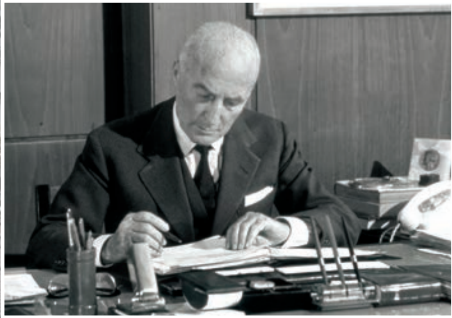
📌 Agostino Rocca, fundador de la Organización Techint y de TenarisTamsa.